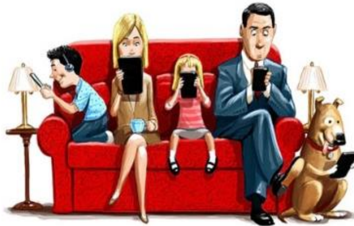
Рис. 3. Ілюстрація розколу сімейного вечора [5]

організація сімейного дозвілля. Тут важливою стає роль архітекторів, так як актуальним постає завдання збільшувати кількість об'єктів архітектури для сімейного дозвілля.