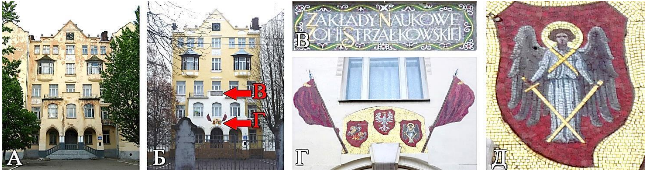
Рис. 2 А. фасад Середньої Загальноосвітньої школи № 6 (м. Львів, вул. Зелена, буд. № 22) до реставраційних робіт 2008 року. Фото: ru.wikipedia.org ; Б. Фасад після реставраційних робіт 2008 року. Фото: Н. Піддубна, 2009 р.; В. Мозаїчний напис. Фото: Н. Піддубна, 2009 р.; Г. Мозаїчні герби з прапорами. Фото: Н. Піддубна, 2009 р.; Д. Фрагмент мозаїки – архангел Михаїл з мечами. Фото: Н. Піддубна, 2009 р.

В 2008 р. під час ремонтних робіт на фасаді Середньої Загальноосвітньої школи № 6 ((колишій будинок приватної гімназії № 5), м. Львів, вул. Зелена, буд. № 22), виявили і відкрили мозаїчні композиції, що були затиньковані в середині ХХ століття (див. рис. 2). Автор проекту мозаїки Каєтан Стефанович, виконала польська фірма вітражу та мозаїки С. Г. Желенського на поч. ХХ ст. [3]