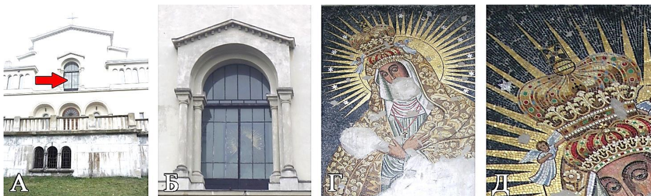
Рис. 1 А. Фасад храму Покрови Пресвятої Богородиці, УГКЦ (колись Костел Матері Божої Остробрамської), м. Львів, вул. Личаківська, № 175.

Суттєво вплинули на стан збереженості архітектонічних декорів та пам'яток на загал – руйнівні війни, а також великого впливу та шкоди мистецькій та архітектурній спадщині завдало тривале панування та господарювання тих чи інших країн на території нашої сучасної держави, а відповідно і на території м. Львова. На догоду певного суспільного замовлення безжалісно знищували чи переформовували на свій лад архітектурні споруди та їх елементи. [1, с. 375-376] Відповідно, серед елементів архітектури м. Львова, які зазнали втрат і змін, є і мозаїчні композиції. Одним із таких прикладів є мозаїчна ікона Богоматері Остробрамської ХХ ст. (див. рис. 1), що знаходиться на рівні другого поверху в каплиці головного фасаду храму Покрови Пресвятої Богородиці, УГКЦ (колись Костел Матері Божої Остробрамської), м. Львів, вул. Личаківська, № 175. Мозаїка виконана за проектом архітектора і Т. Обмінського, майстром В. Печонкою з Кракова [2, с. 14].