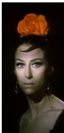
5. Характерний образ балерини