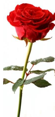
6. Троянда – символ кохання