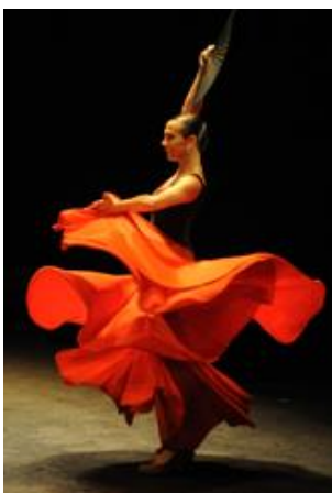
4. Образ Кармен в театральній виставі

В 10-му класі учні виконують завдання з композиції: «Ілюстрація; ілюстрація та її місце у книжковій графіці твору. Робота над створенням образу літературного героя, виконання ілюстрації та її оформлення». В цьому завданні робота над формуванням образу стає залежною від уяви. Вчитель може допомогти учневі з підбором візуально відповідних сюжетів, саме з яких можна скласти цілісний метафоричний образ та виконати ілюстрацію до твору. На цьому прикладі показано як об'єднати художні, музичні та графічні образи в один візуальний ряд. В одному графічному об'єкті поєднуються жіночність, експресія, напруга та трагізм (рис. 4-7).