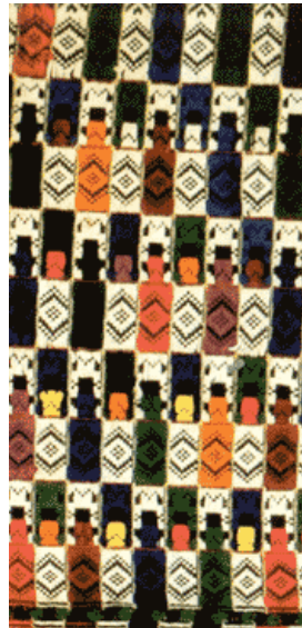
2. Частина національного костюму – плахта