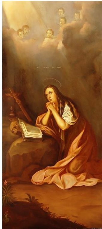
Копія з ікони «Марія Магдалина»

Виконавець Володимир Петренко. 6 курс. 2016 рік. Архів дипломних копій кафедри техніки та реставрації творів мистецтва НАОМА, №96