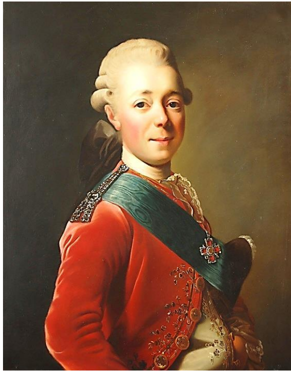
Копія з картини «Портрет Павла І»

Виконавець Шмаленко. 6 курс. 2007 рік. Архів дипломних копій кафедри техніки та реставрації творів мистецтва НАОМА №48