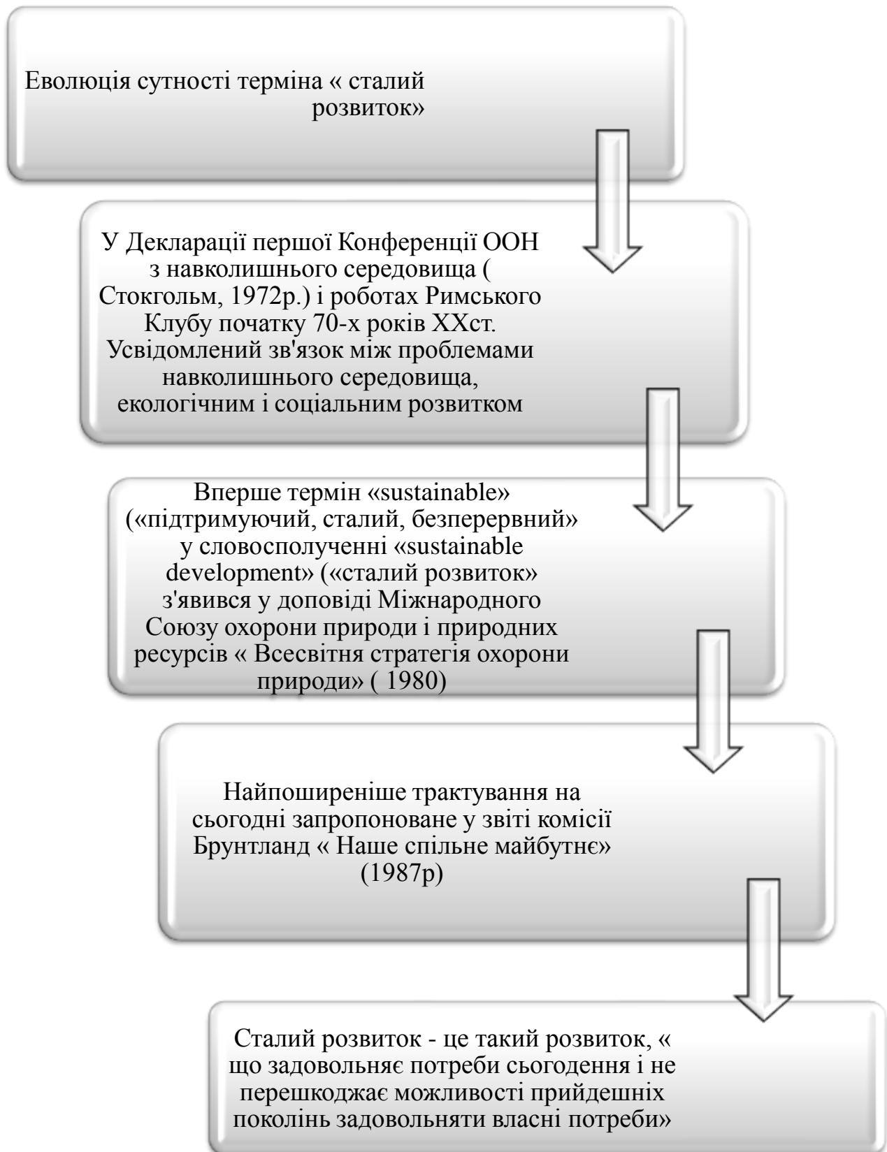
Рис. 1. Еволюція сутності терміну « сталий розвиток»

Концепція сталого розвитку – перший крок на шляху вдосконалення та включення у процес формування стратегії розвитку продуктивних сил України.