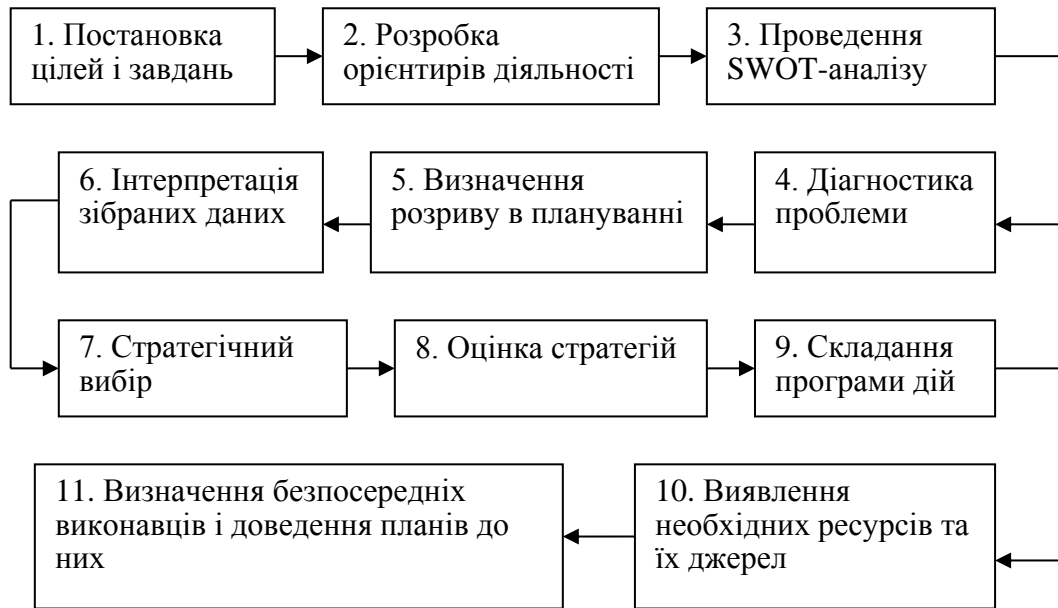
Рис. 3. Процес міського планування

Важливе значення для впровадження організаційно-економічних та нормативно-правових методів управління соціально-економічним розвитком малих міст має Закон України «Про затвердження Загальнодержавної програми розвитку малих міст» (2004 р.) [2]. Програма спрямовує діяльність на забезпечення позитивних зрушень в економічному та соціальному стані малих міст, поліпшення життєвого рівня населення, ефективного використання ресурсного та науково-виробничого потенціалу. Програма дає змогу органам місцевого самоврядування та органам виконавчої влади самостійно складати і реалізовувати плани відродження та розвитку малих міст з використанням для цього відповідної державної підтримки. Програма сприяє активному залученню до цієї роботи кадрів місцевих органів виконавчої влади, населення та суб'єктів підприємницької діяльності.