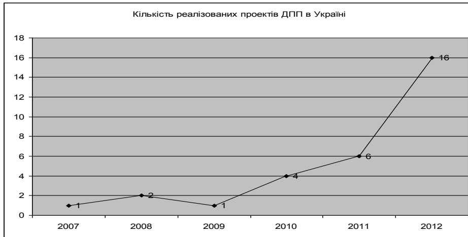
Рис. 1. Динаміка ДПП в Україні в 2007-2012 рр.

Джерело: розроблено автором за даними [1]