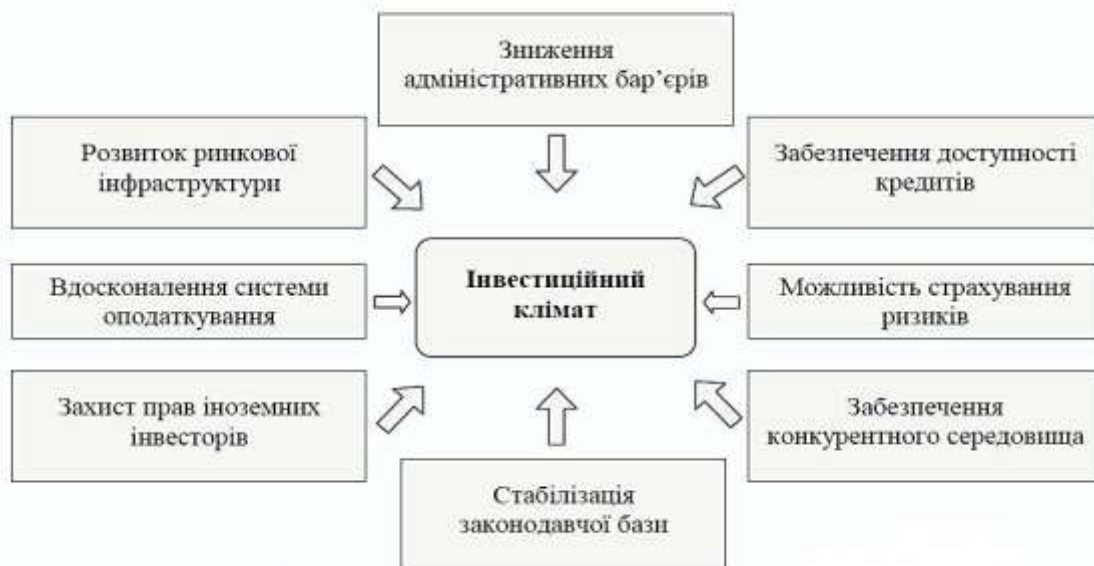
Рис. 1. Чинники впливу на інвестиційний клімат [1]

Для України найпоширенішими формами інвестиційної діяльності є інвестицій в основний капітал та прямі іноземні інвестиції.