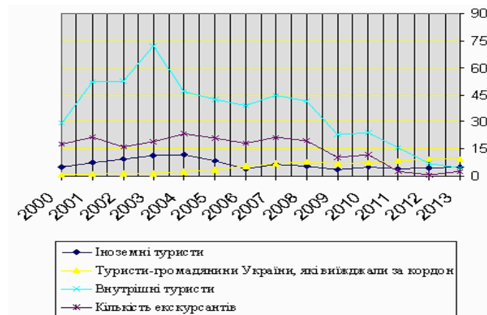
Рис. 2. Туристичні потоки країни (тисяч осіб)

розглянемо рисунок 2, то можна побачити потоки туристів країни за той самий період що і на рисунку 1.