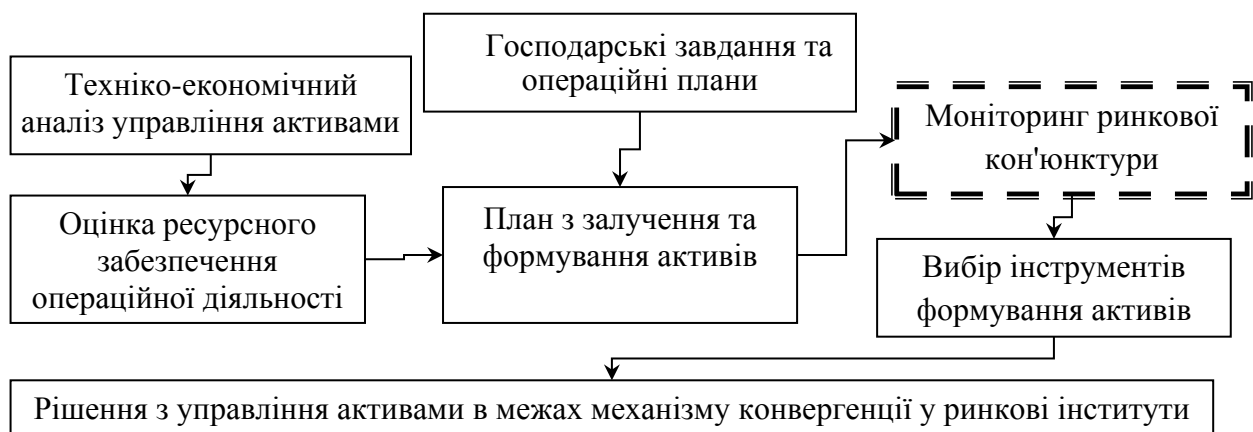
Рис. 1. Місце моніторингу в механізмі управління активами підприємства

За змістовими характеристиками регулярний аналіз оновленої інформації, її збір та опрацювання належать до прикладних проблем моніторингу ринкового середовища, що, на нашу думку, доцільно обмежити моніторингом інституційної системи, охопленої механізмом конвергенції. Тобто, очевидним є факт необхідності створення системи моніторингу, що забезпечує прийняття управлінських рішень в межах цільових завдань підприємства на основі порівняння поточного забезпечення активами, отриманого у формі оціночних значень у ході техніко-економічного аналізу та кон'юнктури інвестиційного, фінансового, банківського секторів, ринків збуту, логістики тощо (рис. 1.).