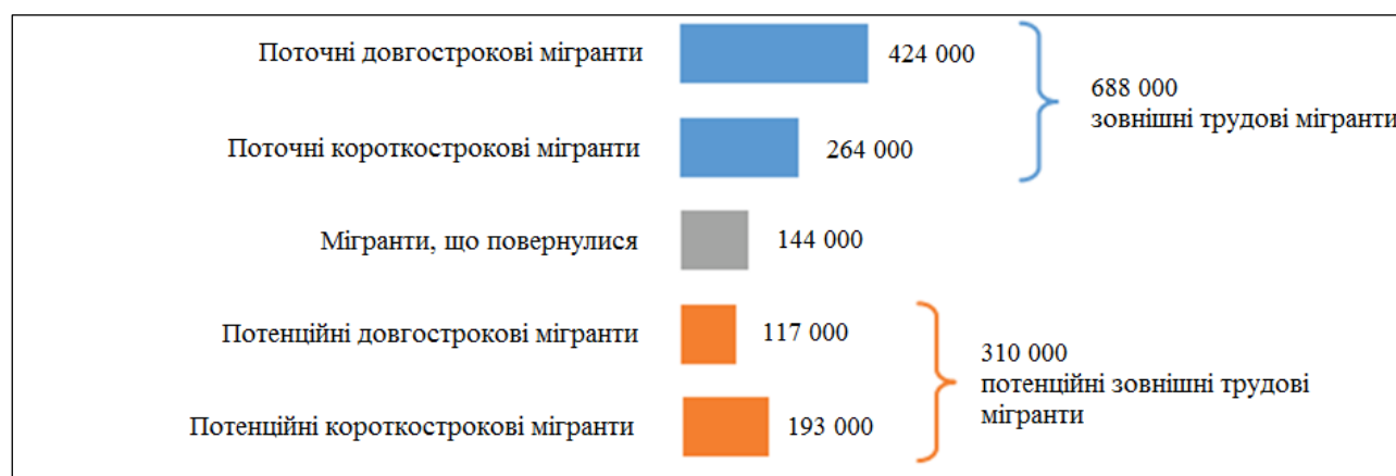
Рис. 2. Кількість українських трудових мігрантів (2014-2015 рр.)

Результати опитування ДГ демонструють високий потенціал потоків міжнародної трудової міграції в короткостроковій перспективі, через те, що 310000 людей висловили свій намір долучитися до довгострокової або короткострокової трудової міграції у найближчі 12 місяців. Це говорить про те, що можливе потенційне збільшення кількості міжнародних трудових мігрантів на 41% (рис. 2)