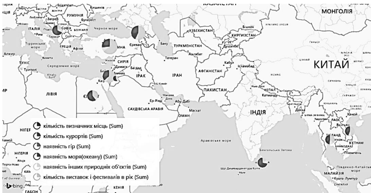
Рис. 1. Кількості туристичних рекреацій по основних країнах виїзду громадян України за 2015 рр. у PowerMap