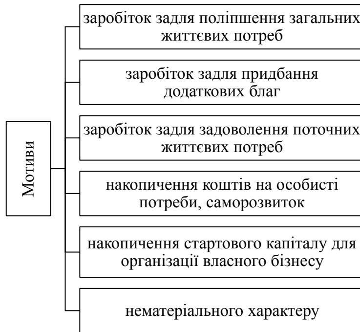
Рис. 1. Мотиви, які зумовлюють міжнародну міграцію робочої сили

Мобільність трудових мігрантів в Україні стрімко зростає за рахунок перетинів її західного кордону (рис. 2).