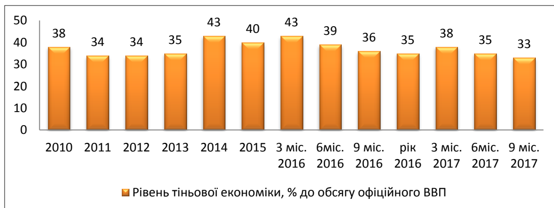
Рис. 1. Інтегральний показник рівня тіньової економіки в Україні (у % від обсягу офіційного ВВП)

У січні-вересні 2017 року за останніми розрахунками Міністерства економічного розвитку та торгівлі обсяг тіньової економіки було зафіксовано 33% від офіційного ВВП, це означає що на 3% менше за показник 9 місяців 2016 року (рис. 1).