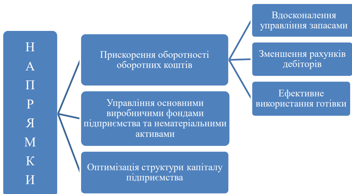
Рис. 1. Напрями підвищення ефективності використання фінансових ресурсів