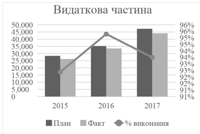
Рис. 3. Виконання видаткової частини бюджету Дніпропетровської області, млн. грн

Доходна частина протягом останніх років виконується в повному обсязі, де відсоток виконання планових показників з 2015 по 2017 рр. дослідження становив 103%, 105%, 101% відповідно.