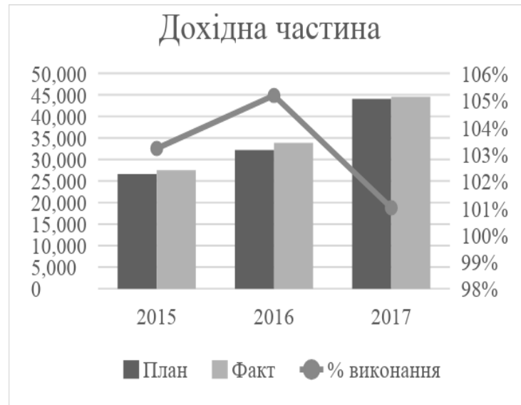
Рис. 2. Виконання доходної частини бюджету Дніпропетровської області, млн. грн