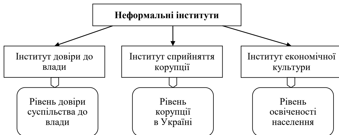
Рис. 2. Неформальні інститути, які мають вплив на забезпечення стійкості сектору ЗДУ