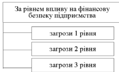
Рис. 4. Систематизація загроз по рівню впливу на фінансову безпеку підприємства [5]

Класифікація загроз по рівню впливу на фінансову безпеку – на рисунку 4.