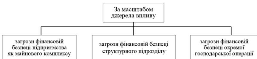
Рис. 2. Систематизація викликів фінансовій безпеці підприємства за масштабом джерела впливу [5]

Класифікація загроз щодо фінансової безпеки за масштабом джерела впливу представлена на рис. 2.