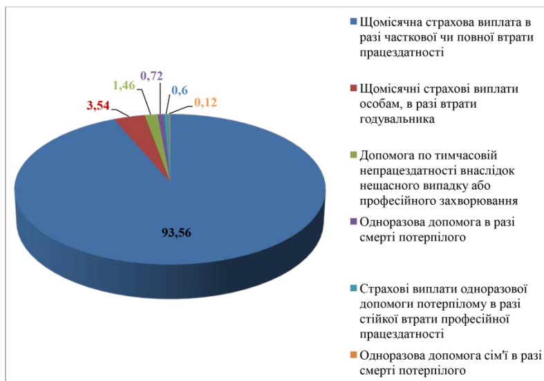
Рис. 2. Структура випланих коштів за видами виплат у 2020 році, %

У 2014 році був заснований Фонд соціального страхування України. Ця установа здійснює певні виплати для потерпілих внаслідок нещасного випадку на виробництві або професійного захворювання. Серед них: щомісячна страхова виплата в разі часткової чи повної втрати працездатності, що компенсує відповідну частину втраченого заробітку потерпілого, одноразова допомога сім'ї в разі смерті потерпілого, щомісячні страхові виплати особам в разі втрати годувальника, одноразова допомога в разі смерті потерпілого, страхові виплати одноразової допомоги потерпілому в разі стійкої втрати професійної працездатності, допомога по тимчасовій непрацездатності внаслідок нещасного випадку або професійного захворювання та інші виплати (рис. 2) [5].