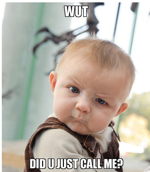
Рис. 2. Мем «малюк із скептичним поглядом»