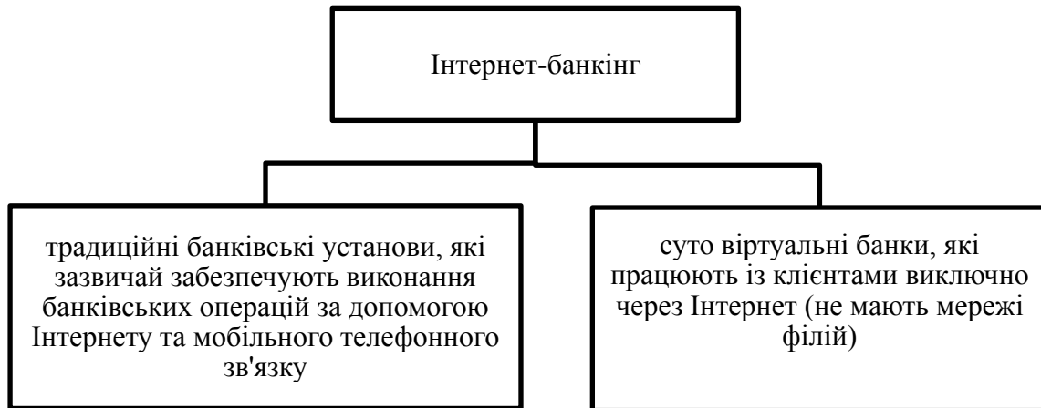
Рис. 2. Моделі Інтернет-банкінгу