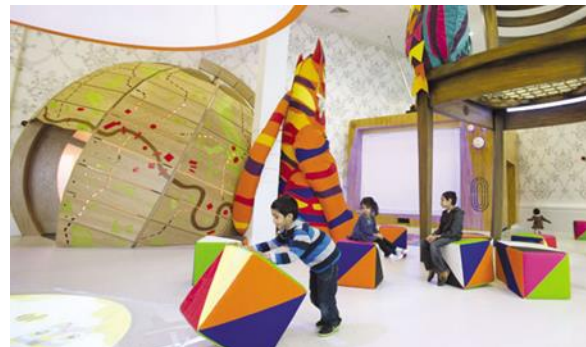
Рис. 1. Використання інтерактивного екрану в дизайні лікарні «Ann Riches», м. Лондон