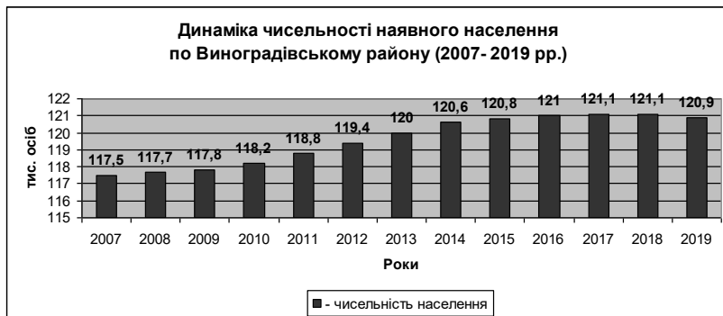
Рис. 1. Динаміка чисельності наявного населення Виноградівського району (2007-2019 рр.)

Джерело: розроблено автором за даними [1; 2; 3]