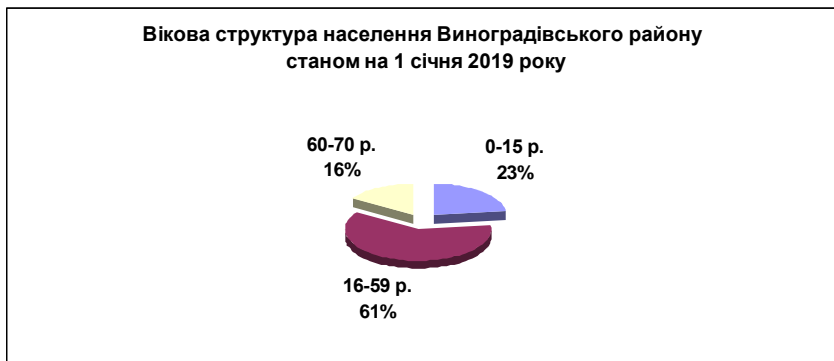
Рис. 5. Вікова структура населення по Виноградівському району станом на 1 січня 2019 року