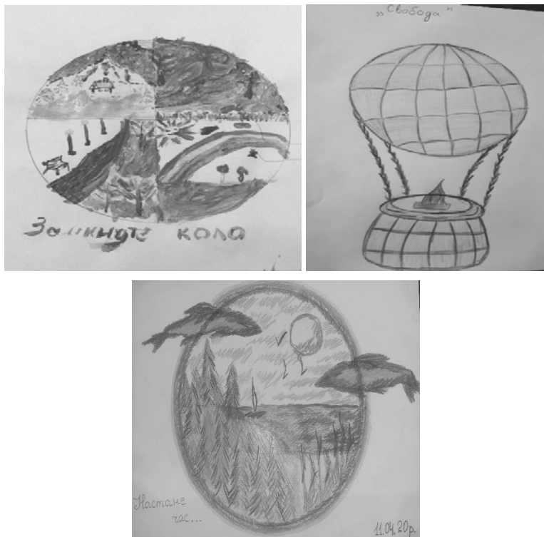
Рис. 2. Мандали, пов'язані із ціннісно-сисловою сферою

Чимало мандал, особливо намальованих жінками, через кольорову гаму та символіку сигналізують про силу та інтенсивність емоційних та особистісних переживань. Зазвичай, вони пов'язані із бажання відпочинку, задоволення, потребі в естетичному задоволенні від споглядання краси природи, що так актуально для весняного періоду, на який припадає час карантину.