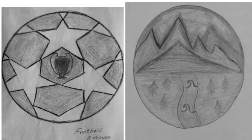
Рис. 1. Мандали, пов'язані із мотиваційною сферою

Відзначимо, що мотиваційні тенденції відображені у мандалах із назвами «Футбол», «Дорога у нове життя», «Коли є нова ідея», «Вибір» і в смислових повідомленнях «Все буде добре», «Найскладніше у житті – це вибір», «Не потрібно опускати руки після кожного падіння», «Все омріяне збудеться!» «Хочеться жити та йти вперед» свідчать про позитивне налаштування, оптимізм, віру у краще та бажання конструктивних змін у житті. Намальовані мандали такого типу, як правило, яскраві, насичені символами та елементами, що вказують на досягнення (рис. 1).