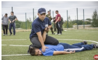
Фото 1. Больові прийоми

1. Больових прийомів – це дії спрямовані на тимчасове обмеження (та навіть припинення) рухомості людини за допомогою больових впливів на чутливі ділянки тіла [1, с. 63].