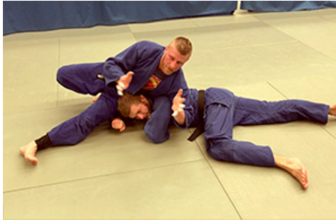
Фото 5. Задушливий прийом

4. Кидками – це складна в технічному виконанні група прийомів, які використовуються під час фізичного протиборства на близькій дистанції, зазвичай без чисельної переваги супротивників [1, с. 67].