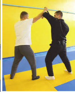
Фото 2. Боковий удар Фото 3. Удар навідліг Фото 4. Удар зверху Класифікація ударів: