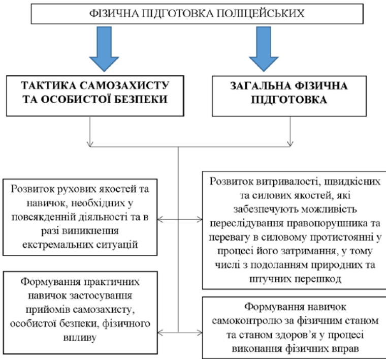
Рис. 1. Складові та завдання фізичної підготовки працівників Національної поліції України

Фізична підготовка є складовою системи службової підготовки поліцейських. Організація службової підготовки працівників Національної поліції України здійснюється відповідно до Наказу МВС України № 50 від 26 січня 2016 р.