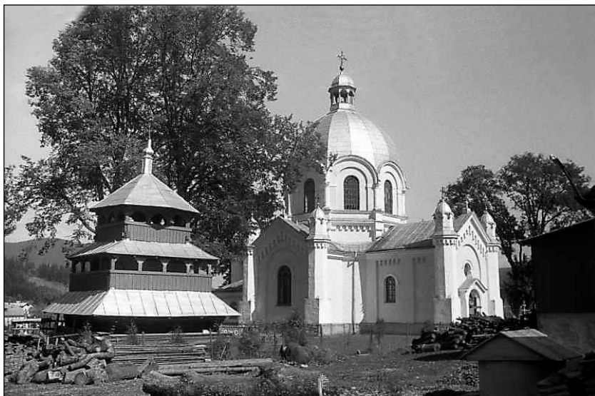
Рис. 2. Вид з позиції А 4 на церкву Успіння Пресвятої Богородиці з дзвіницею Самбірсько-Дрогобицької єпархії Української греко-католицької церкви у смт Славське Сколівського р-ну Львівської обл., 20 вересня 1993 р., М. І. Жарких. Цифрова копія чорно-білого негативу 0-го розміру під № 838-35 у колекції автора

Джерело: https://www.pslava.info/SlavskeSmt_Cerk_838-35a,242198.html