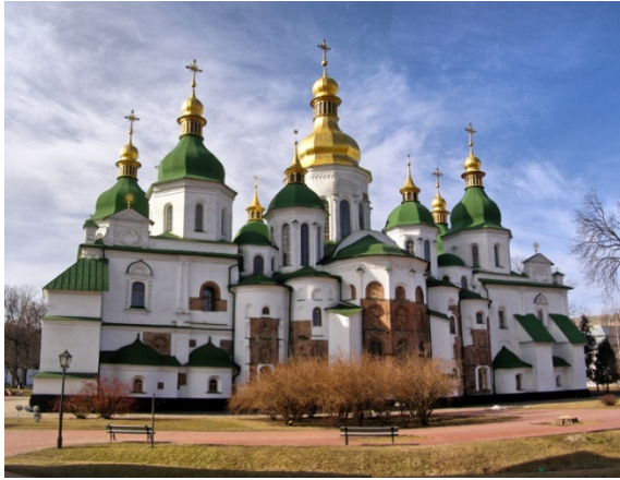
Рис. 2. Софійський собор