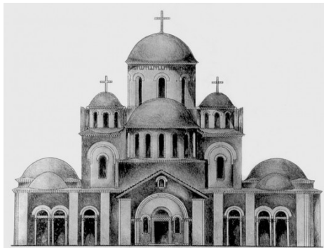
Рис. 1. Десятинна церква