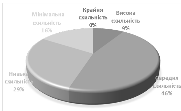
Рис. 2. Дослідження рівня правосвідомості із використанням методики «Дослідження схильності до відхилення поведінки» (Орел О.)

Особливості правосвідомості працівників правоохоронних органів формуються саме у процесі юридичного навчання і становлять загальну та спеціальну правову підготовку та інші знання і вміння. Це загальна правова підготовка, спеціальна правова підготовка, загальна фізична підготовка, бойова підготовка, в тому числі володіння табельною зброєю, оволодіння засобами зв'язку, уміння керувати транспортними засобами та ін. [1].