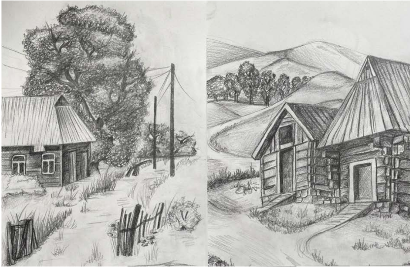
Рис. 1. Сільські пейзажі