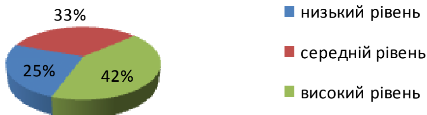
Рис. 2.3. Рівень педагогічної культури батьків та готовності щодо формування просоціальних поведінки та морально-етичних цінностей підлітків

Таким чином, підлітки, що увійшли до 2-ої та 3-ої групи, потребували соціально-педагогічної підтримки; 60% учителів потрібно було надати допомогу у підготовці до формування просоціальних поведінки та морально-етичних цінностей у підлітків; 58% батькам необхідно було допомогти у соціально-педагогічній просвітницькій роботі щодо підвищення рівня педагогічної культури.