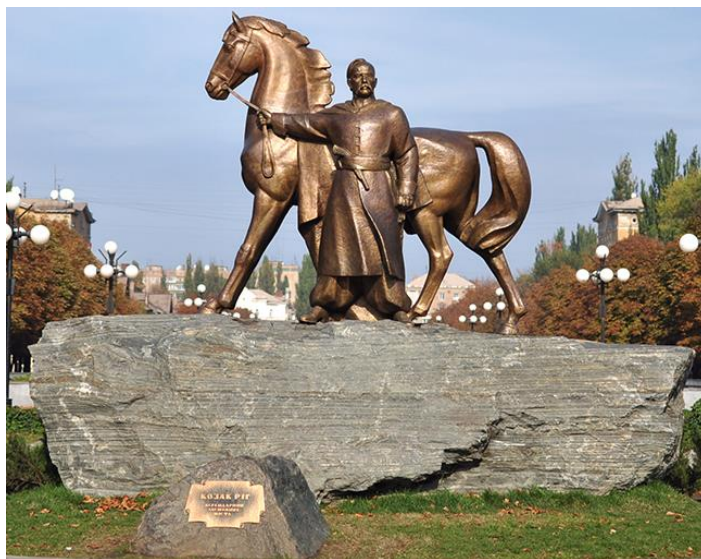
Рис. 2. Пам'ятник «Козак Ріг»

Пізніше можна ознайомити дітей з пам'ятником «Козак Ріг» [2] (рис. 2).