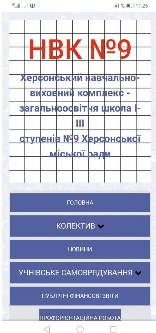
Рис. 1. Візуалізація фрагменту сайту НВК № 9 (м. Херсон)