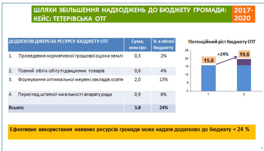
Рис. 2. Шляхи збільшення доходів до бюджету Тетерівської громади Житомирської області

Підсумовуючи, додаткові можливості і резерви збільшення надходжень до бюджетів громад, в першу чергу це [3]: