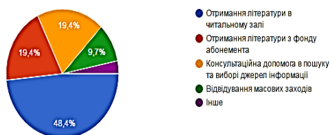
Рис. 1. Форми бібліотечно-інформаційних послуг, якими найчастіше користуються

Якими формами бібліотечно-інформаційних послуг Ви користуєтесь найчастіше?