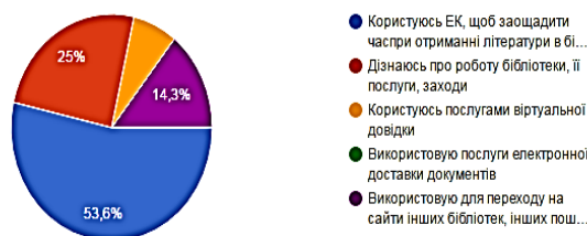
Рис. 4. Використання інформації з сайту бібліотеки

Яку інформацію з сайту бібліотеки Ви використовуєте?