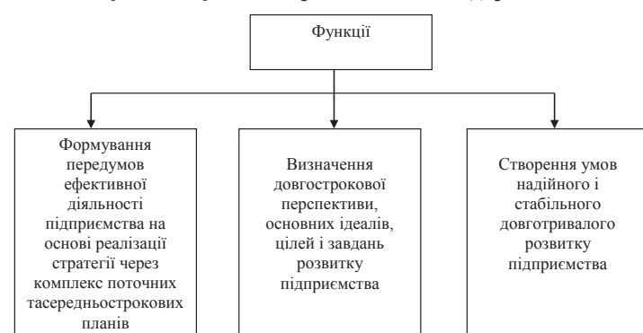
Рис. 2. Функції стратегічного планування