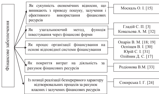
Рис. 1.2. Наукові течії до визначення сутності дефініції «фінансове забезпечення» *