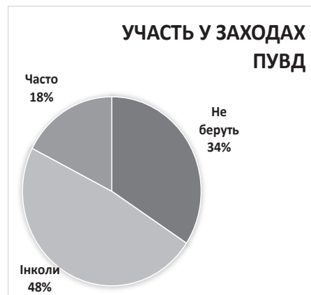
Рис. 1. Аналіз участі підлітків у позаурочній виховній діяльності

Більшість опитаних (87% респондентів) хочуть бути включеними в цю діяльність, і лише 8,0% не бажають взагалі брати участь у спільній позаурочній виховній діяльності з однолітками (рис. 2).