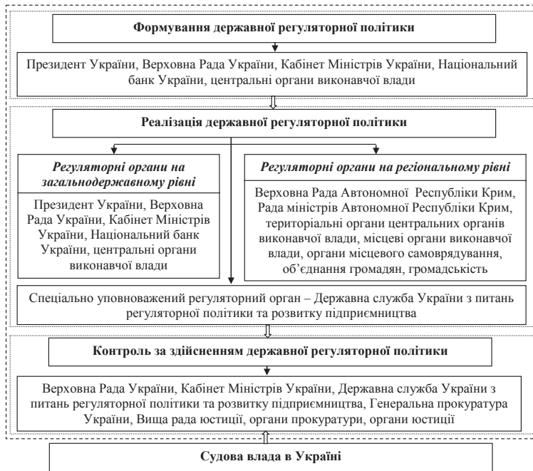
Рис. 1. Інституційно-організаційне забезпечення державної регуляторної політики в Україні