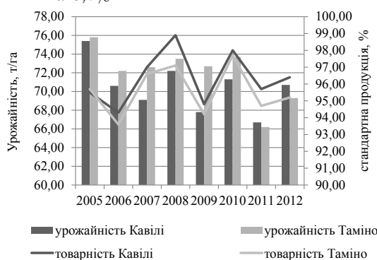
Рис. 2. Урожайність та вихід стандартної продукції кабачків

Урожайність кабачків сильно коливається в залежності від маси і розмірів плоду: при масі зеленця 0,24...0,35 кг урожайність становить 46...75 т/га, якщо маса кабачка 0,9-1,4 кг, то урожайність може перевищувати 100 т/га [11, с. 35]. За нашими даними, досліджувані гібриди виявилися досить урожайними (рис. 2), адже збирали плоди масою до 350 г та довжиною від 16 до 21 см (зеленці). Середня врожайність гібриду Таміно вища у порівнянні з Кавілі на 1,5 т/га. Однак за виходом стандартної продукції Таміно F1 поступається Кавілі F1 на 0,7%.