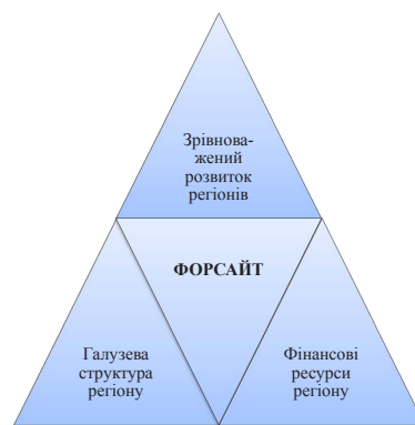
Рис. 2. Узагальнені вихідні дані для форсайту аграрних підприємств*

Звичайно, при використанні форсайту повинні бути враховані регіональні аспекти. Беручи за основу зрівноважений розвиток регіонів й враховуючи похибки на галузеву структуру певного регіону можна буде використовувати форсайт, як вихідну площадку для дослідження майбутнього всіма суб'єктами господарювання й політики (рис. 2).