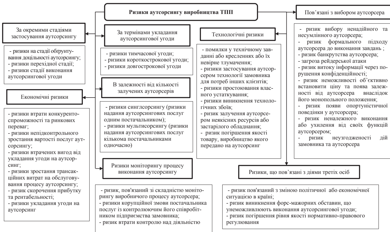
Рис. 1. Класифікація ризиків аутсорсингу виробництва ТПП