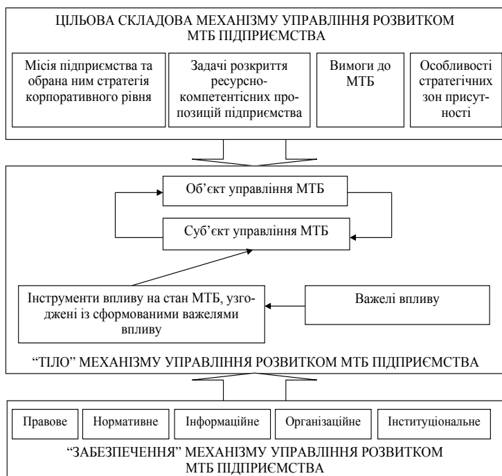
Рис. 3. Структуризація механізму управління розвитком МТБ підприємства

Для вдосконалення управління МТБ на підприємстві важливим є комплексне застосування сучасних підходів. Виявлено, що до таких підходів належить логістика, реінжиніринг і контролінг, які спираються на ряд однакових підходів і принципів, таких як процесний підхід, системний підхід, орієнтація на замовника, підвищення відповідальності працівників усіх