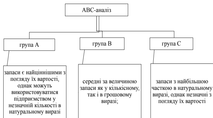
Рис. 2. ABC-аналіз матеріально-технічної бази підприємства

Важливою умовою ефективного функціонування виробництва є добре налагоджене матеріально-технічне забезпечення, що здійснюється за допомогою відповідних служб. Головним завданням служби МТЗ підприємства є своєчасне і оптимальне забезпечення виробництва необхідними ресурсами відповідної комплектності та якості, що реалізується за допомогою виконання основних функцій (рис. 1).