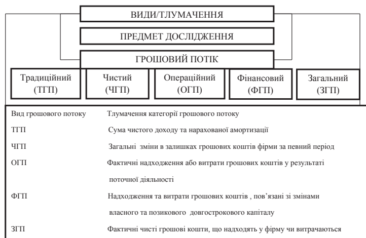
Рис. 1.1. Схема визначення грошового потоку за ознакою методу його розрахунку [6]

Чистий рух грошових коштів, отриманий при здійсненні операційної діяльності, у світовій прак-