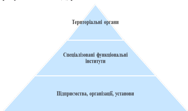
Рис. 2. Ієрархічна структура регулювання зовнішньоекономічної діяльності в регіоні

Висновки та пропозиції. Регулювання зовнішньоекономічної діяльності у регіональному контексті має значний вплив на діяльність конкретних суб'єктів господарювання та держави в цілому. Тому, нами було сформована ієрархія структури регулювання ЗЕД, рис. 2.