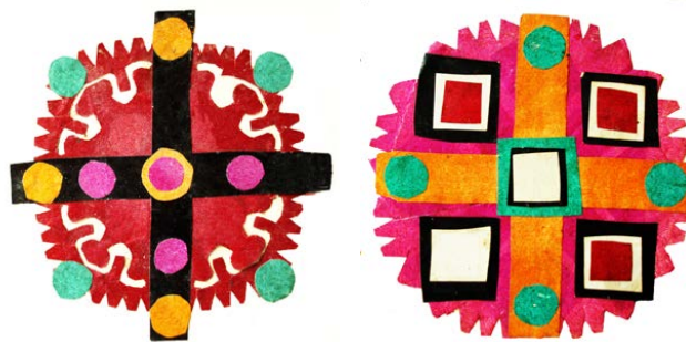
Рис. 5. Витинанки розеткові складені, поч. XX ст., нині Тлумацький і Городенківський р-ни Івано-Франківської обл. Папір, вирізування. НМЛ

дерев'яними інкрустованими тарелями цього регіону, цукорницями, табакерками тощо [2, с. 179, іл. 7, 8, 10].