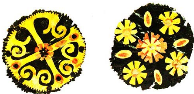
Рис. 2. Витинанки розеткові складені. Перша третина ХХ ст., нині Кам'янець-Подільський р-н Хмельницької обл. Папір, вирізування. НМУНДМ

Розглядаючи складені розеткові витинанки Поділля, зазначимо, що особливо цікаві їх зразки збережено в Національному музеї українського народного декоративного мистецтва (Київ. Далі НМУНДМ). Загальний вигляд оздоб і орнаментика часто нагадують керамічні миски краю [див.: 4, с. 28; 5, с. 71]. На деяких витинанках укладено на темному контрастному тлі великі зображення шести- восьмипроменевих зірок 12 , монументальні силуети птахів 13 , розлогі хрещаті схеми з листками, стилізованими квітами, закрученими «баранчими рогами», дрібними кружками тощо.