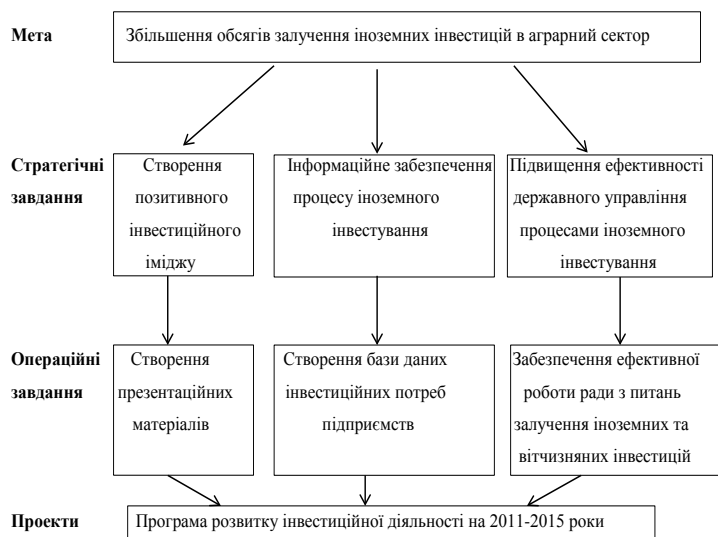
Рис. 2. Стратегія розвитку інвестиційної діяльності Миколаївської області

• створення гнучкої податкової системи з диференціацією об'єктів і суб'єктів оподаткування, що сприятиме збільшенню обсягів нагромадження інвестиційного капіталу;