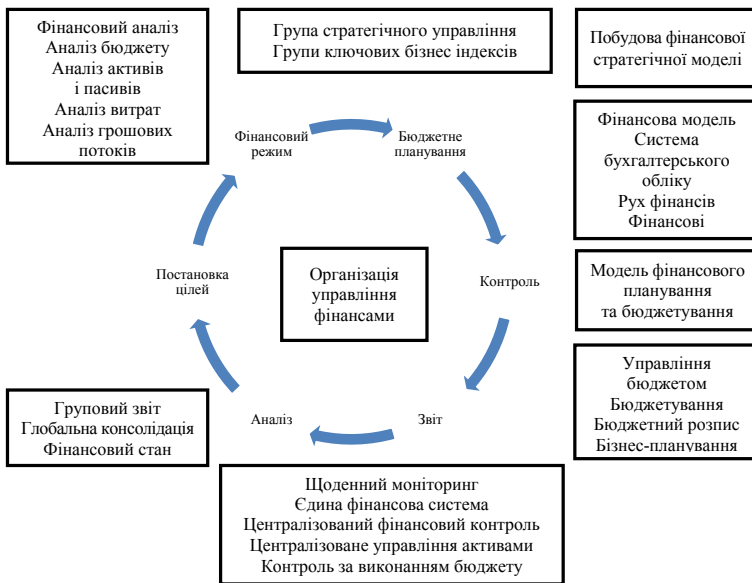
Рис. 3. Механізм організації управління фінансами на зарубіжних агропідприємствах

Аналіз змісту, особливостей застосування, переваг і недоліків зазначених методів, сферу їх застосування та відповідність сучасним умовам господарювання представлені нами в табл. 1.