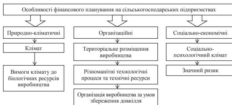
Рис. 1. Особливості фінансового планування на вітчизняних агропідприємствах

Аналізуючи досвід розвинутих країн, зокрема США, Японії і Німеччини, можемо зробити наступний висновок: нормативно-правове забезпечення фінансового планування у кожній країні відповідає специфіці кожної країни. Для зарубіжних агропідприємств характерні такі види планів: Corporate Charter (статут) і Strategic Business Plan (стратегічний бізнес-план). Основою планування більшості середніх і дрібних зарубіжних агропідприємств є річні бюджети з їх подальшою деталізацією у вигляді операційних бюджетів (на квартал, місяць, тиждень). До них відносять: Business Plan (бізнес-план) та Sales and Operation Plan (план збуту і виробництва – портфель продукції), про що йдеться в науковому дослідженні В.М. Коваленко, О.Ю. Нестор [8].