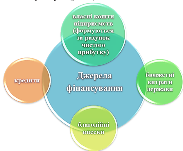
Рис. 1. Джерела фінансування заходів, спрямованих на покращання охорони праці

Джерелами фінансування заходів, спрямованих на покращання охорони праці на підприємстві можуть бути (рис. 1).