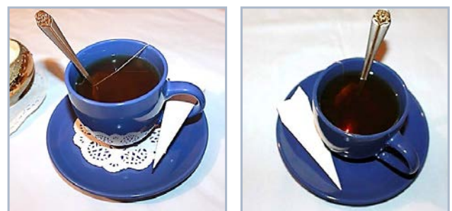
Рис. 3. Варіанти розташування етикетки у чашці

Наявність ребр жорсткості і правильно підібраний розмір унеможливають попадання етикетки у чай навіть під час наливання у чашку окропу; для зручності етикетку можна розташувати у ручці чашки (рис. 3).