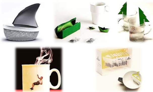
Рис. 1. Приклади чайних ярличків

Альтернативним напрямом вирішення означеної проблеми є використання для виготовлення ярличків нетрадиційних матеріалів: металів, полімерів, комбінованих матеріалів, які при контакті з рідиною виключають розчинення у ній. Але застосування такого підходу здорожує ярличок та ускладнює його утилізацію після використання.