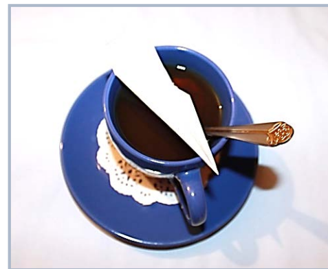
Рис. 2. Загальний вигляд чайної етикетки

Виклад основного матеріалу. У роботі представлено конструкцію етикетки для чайного пакетика, яка за формою являє собою літачок, складений з паперу (рис. 2).