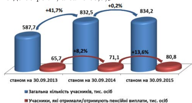
Рис. 1. Динаміка кількості учасників недержавних пенсійних фондів

Разом з тим спостерігаємо збільшення загальної кількості учасників НПФ, яка становить 834,2 тис. осіб (див. рис. 1). Більшість учасників недержавних пенсійних фондів є особи віком від 25 до 50 років, а саме 63,5%.